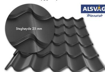
Total byggehøyde er 65 mm.